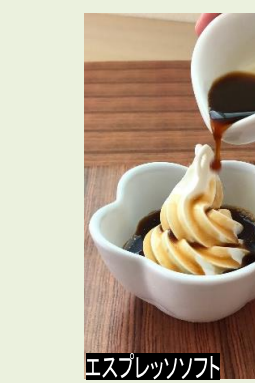
エスプレッソソフト