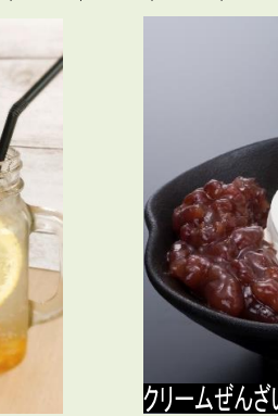
クリームぜんざい