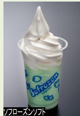
ソフトローズンソフト