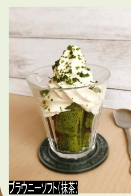
ブラウニーソフト(抹茶)