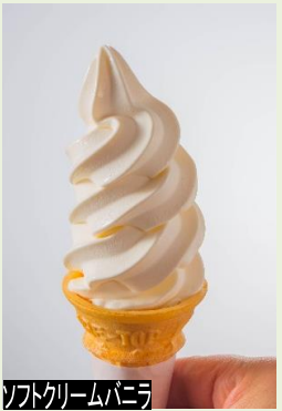
ソフトクリームバニラ