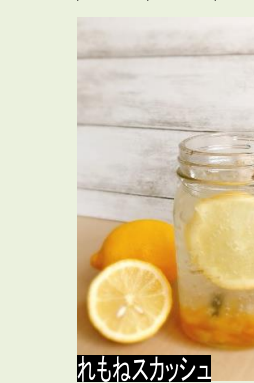
れもねスカッシュ