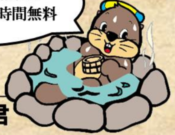
天然温泉 湯の花 マスコットキャラクター ゆうゆう君