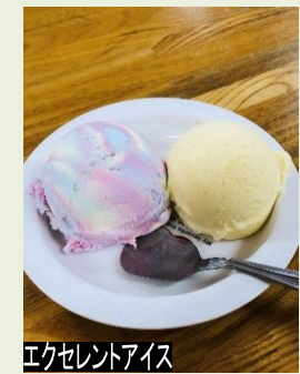
エクセレントアイス